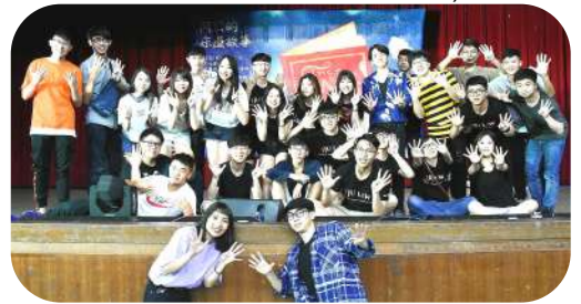
▲ 全體工作人員大合照

財法系於 2018 年 5 月 23 日在百鍊廳舉辦財法之夜 The Shape Of Law-這就是《愛》，每年固定會舉辦的財法之夜，讓平常不甚熟悉的各年級學生，能欣賞彼此帶來的表演，讓彼此的感情更加融洽。