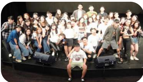
▲ 全體工作人員大合照