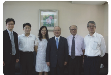
▲ 顏大和檢察總長(右三)