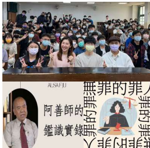
▲ 阿善師的鑑識實錄