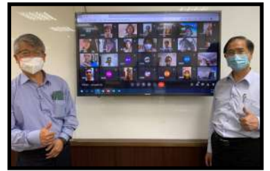
▲會後合影 郭土木院長(左)、鄭天財委員(右)

2022年5月6日邀請到原民立委鄭天財委員親臨本校財法系原住民專班進行演講，演講主題為：原住民權益的實踐。委員從憲法增修條文第10條第11項第12項、原住民族基本法、原住民身分法、姓名條例第1條及第4條、森林法第15條第4項、野生動物保育法21條之1、漁業法第44條、山坡地保育利用條例第37條逐一解釋，並介紹立法歷程。讓同學對於原住民族的立法政策，有較完整的了解。講述內容令在場學生們印象深刻，並多有收穫。