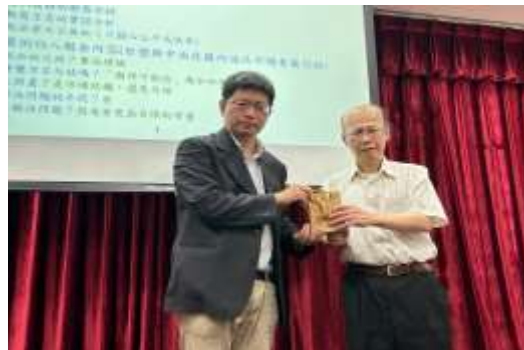
▲院長致贈帥嘉寶法官紀念禮品

2023年5月3日吳志光院長邀請最高行政法院帥嘉寶庭長(輔大法律系畢業、臺大經濟研究所碩士)專題演講「法律經濟學簡介」,精彩內容有:經濟學基本觀念的回顧、法律經濟學之重點介紹、法律經濟學思辯過程的歷史回顧、法律經濟學在司法實務工作中之實際運用經驗、法律學門的獨特價值,參與同學無不收穫滿滿。