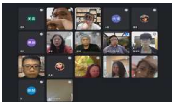
▲ 蔡志偉副教授線上演講合影

2023 年 03 月 17 日邀請東華大學蔡志偉副教授為原民專班演講，演講主題為「國際人權法與原住民族狩獵文化權利」，除有助學生終生學習並加強相關法學知識，深化認識原住民傳統狩獵與其文化之尊重，期加速推動並落實我國原住民相關政策，使專班同學對自身權益及保護有深入之瞭解。