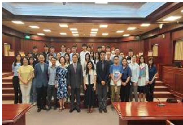
▲ 林俊益大法官及朱健文主任與楊子慧副院長帶領法律學院同學合影

2023年3月15日楊子慧主任邀請輔大法律系畢業(學士、碩士、博士),現任司法院副院長室主任的朱健文學長,以「憲法維護者門徒的奇幻之旅」為題,和在校學弟妹分享個人親炙重量級大法官的人生歷練,國際文化交流的甘苦談,讓同學們瞭解將來從事憲法審判及行政人員的職涯發展上,必須面臨的考驗與因應之道。朱學長更加碼安排5月4日師生參訪司法院活動,由林俊益大法官親自接待參觀大法官會議室及憲法法庭,聽說大法官會議室不開放參觀,這次可是有史以來獨一無二的一團喔!