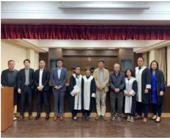
▲ 原住民班模擬法庭展演後合影

本校自 2017 年開辦財經法律學系原住民碩士在職專班 藉此培育原住民之法律人才。為了增加專班同學對於法律應用經驗，並學習法庭活動，同時藉著模擬法庭之審理與討論，讓同學學習將原住民族傳統文化慣習導入訴訟策略，以作為日後實務上之範例研究。2023.03.10 舉辦本專班設立後第三次模擬法庭展演，以本專班居住在烏來地區同學家中所遇到的實際案例為本，探討原住民保留地買賣爭議問題。另一方面也讓旁聽模擬法庭之同學得了解原住民族傳統文化及為保障原住民傳統文化所設之特殊規範可能於實際案例中如何影響案件走向，並將此一爭點意識融會進日常生活，更甚於未來實際經手原住民族案件時，亦能敏銳地意識到可能問題之所在，提升全體原住民族於面對司法程序時，得以獲得更全面之協助。