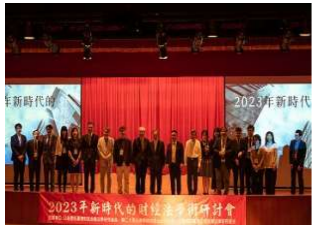
▲ 研討會與會者合影

2023 年 6 月 9 日由輔仁大學法律學院、公益信託台灣財政金融法學研究基金、公益信託台灣公司治理法律研究基金共同主辦，中華公司治理協會、社團法人資誠教育基金會、中華民國會計師公會全國聯合會、萬國法律事務所、宏鑑法律事務所、輔仁大學法律學院財稅規劃實務學程協辦的「2023 年新時代的財經法」學術研討會於輔大國璽樓國際會議廳舉辦。首先由前司法院院長賴英照教授進行專題演講，題目是「網路駭客與內線交易」。接著藉由四個場次主題之探討「後疫情時代下公司證券法制的挑戰與因應」、「虛擬貨幣發行與流通的法律規制及央行數位貨幣」、「數位時代下金融法制未來發展趨勢與挑戰」、「綠色金融與企業永續發展的 ESG 法律議題」，邀請國內法學、會計相關之學者專家共同進行研討，疫情後新時代下各種新興之財經法議題，在理論與實務上皆具有極為重要之研討價值，值得各界關注。