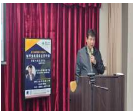
▲ 主講人:葉明功教授

2023 年 3 月 14 日第一場專題演講邀請前食藥署署長葉明功教授帶來<台灣生技醫藥產業介紹>，展望台灣 2025 年生物科技產業產值達四兆、新增 10 萬個就業機會、促進全民健康福祉、強化國際運籌。2023 年 5 月 2 日第二場專題演講邀請聯合醫事法政研究中心主任劉威佐醫師帶來<我國近十五年醫療及輔助醫療行為之法律實務見解變遷及風險管理>，劉醫師首先說明醫療輔助行為和醫療行為的區別，並一一分析案例的變遷，同學們收穫豐碩。2023 年 5 月 16 日第三場專題演講邀請中央研究院院士林昭庚教授帶來<中醫針灸科學化的發展、政策與法制探討>，關於中醫針灸的為未來在法制面應建立具台灣優勢特色之研發策略與法規，配合產業發展，解決中醫藥產業停滯發展困境。老師們帶來的分享内容精闢全面，同學們互益良多。