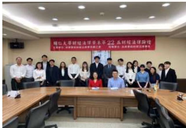
財法論壇全體人員閉幕合影

2023 年 5 月 17 日 財經法律學系碩士班學生假樹德樓舉辦「第 22 屆財經法律論壇」。本論壇自 93 學年度至今已舉辦 22 屆，完全由研究生主導研討會相關事務，主要由本系研究生擔任報告人、與談人，本屆邀請台灣大學、高雄大學及東吳大學研究生擔任報告人及與談人，並邀院內老師擔任主持人。本次論壇為疫情後首次全實體舉行，研究生參與熱烈，希望促使同學及師長透過本活動達到學術交流及研討之目的。