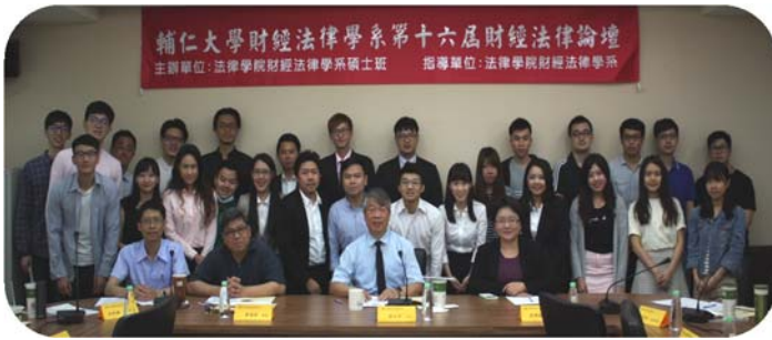
▲ 財法論壇全體人員合影

財經法律學系碩士班二年級學生於2017年5月10日於樹德樓317會議室舉辦「第十六屆財經法律論壇」。本論壇自93學年度至今已舉辦16屆，完全由研究生主導主辦研討會事務，由本系研究生擔任報告人、與談人，並邀請東吳大學法研所碩士生及博士生擔任報告人，另外邀請系上老師擔任主持人及與談人，藉由本活動達到學術交流及研討之目的。