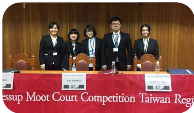
▲ 社員於傑賽普國際法模擬法庭辯論賽合影

國際法研究社成立之主要為目的有二：一是透過國際辯論賽全程使用英語撰寫書狀、論述主張及答辯，培養學生專業英語能力及拓展國際視野。其次是加強學生對國際法之整體理解與應用能力。國際法研究社於 105 學年度第 2 學期並獲得本校校內學生學習成果暨學術競賽獎勵。