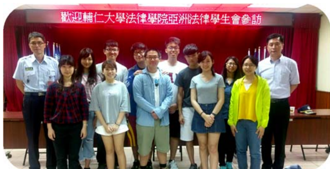
▲ 台北看守所參訪合影

除了演講外，本學期 ALSA 的參訪包括：2016 年 10 月 19 日參觀台灣高等法院、2017 年 4 月 26 日新北地檢署，瞭解法院作業流程、旁聽法官開庭、及書記官等司法人員的工作，對會員決定是否從事相關職業有相當大幫助。5 月 3 日參觀台北看守所，看到收容人的房間、刑場、活動場地等，近距離接觸到收容人的生活，也深思收容人人權議題；5 月 26 日在立法院很幸運適逢部分法案三讀程序，都是非常難得的經驗。