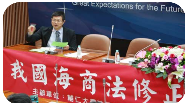
▲ 黃裕凱教授說明研修草案之調整與增進之總體面