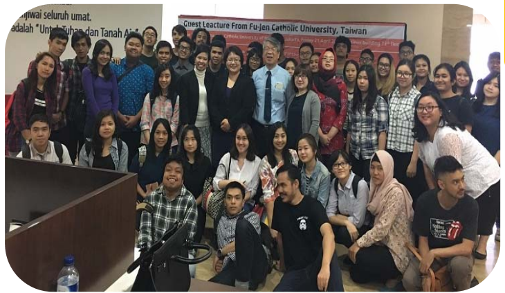
▲ 演講現場參與人數盛況空前