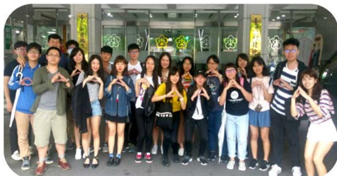
▲ 新北地檢署參訪合影