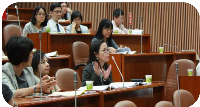
▲ 與會人士踴躍發言討論

我國 1999 年修正的海商法，面對國際航運環境及海事海商國際立法之快速變動、兩岸航貿交往頻繁，以及北歐各國、德國、日本、大陸地區海商法之研修等，已有全面檢討修正之必要。法律學界於 2012 年底召開九場研討會，於 2014 年完成學術版『海商法修正建議』485 條文。交通部(航港局)的官方研修於 2013 年底啟動，由『台灣海商法學會』承接研修，動員國內超過十位的專家學者，歷經三年多，於今年初完成 229 條文的修正草案。本院 2017 年 5 月 26 日於野聲樓谷欣廳主辦「我國海商法修正研討會系列(十) - 台灣海商法學會『海商法修正草案』之調整與增進」研討會，針對總體面、基礎法學面、航運實務面，及程序法暨司法實務面四大面向，分別提出看法與討論，期使我國的海商新法更好、更周延、更符合實務及國際規範。