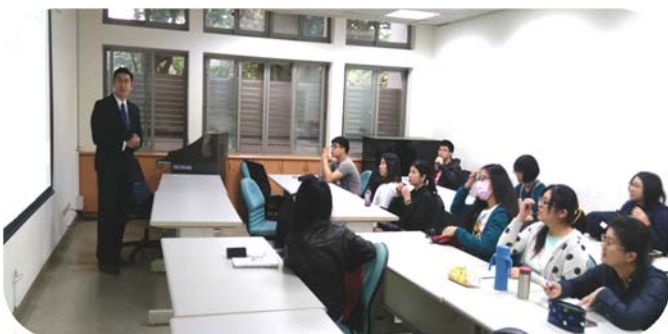
▲ 律師分享律師工作甘苦

為結合產學，105學年本院所開法律實務實習課程中，除要求修課學生至少5次週六前往法律服務中心，進行法律諮詢，親自接觸民眾與真實案件。也為了提早使其瞭解律師業務及事務所經營，特邀請已執業的律師學長為學生講授律師工作及展望、與當事人面談技巧、行政書狀心得、刑事書狀心得、民事書狀心得、民事執行經驗及注意事項、智慧財產或勞工案件經驗、律師事務所之經營等8次演講。學長姐們大方分享私房秘技，甚至分享失敗經驗，讓學生受益很大。